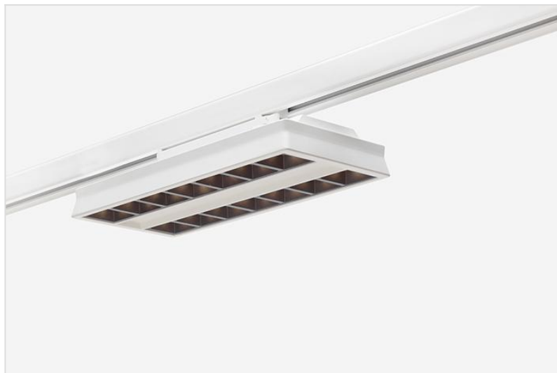
Runway flex met witte behuizing en darklight optics

Runway Flex is een flexibel armatuur voor algemene verlichting van moderne, dynamische kantoren waar indelingen kunnen veranderen.