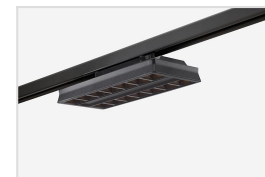
Runway flex met zwarte behuizing en darklight optics