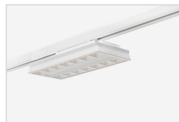
Runway flex met witte behuizing en softlight optics

De Zigbee uitvoering is gebaseerd op het MasterConnect-systeem van Philips, waardoor deze toestellen draadloos aangestuurd kunnen worden. Eenvoudig indienst te stellen, met behulp van een smartphone of tablet, dankzij de gratis MasterConnect-app. Lystra Zigbee heeft voldoende aan een standaard 3-fase rail, hierdoor zijn deze toestellen geschikt voor zowel retrofit- als nieuwe projecten.