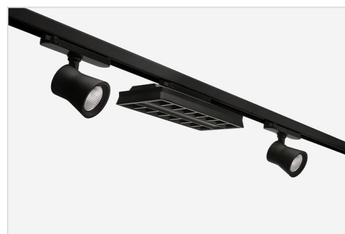
Runway Flex in combinatie met Runway XS